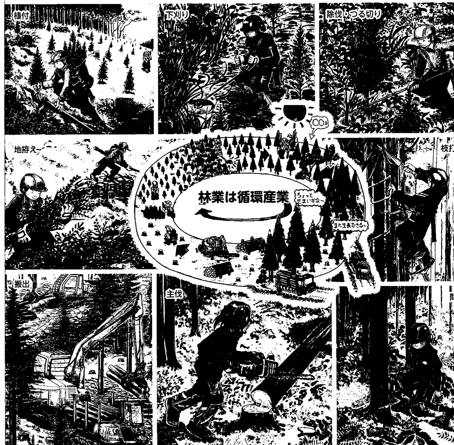
協力：林野図書資料館、イラスト：平田美紗子

専門的かつ高度な知識・技術・技能を有し、森林施業を効率的に行える現場技能者の育成に取り組む林業経営体を応援します。