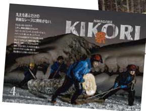
過去の「きこり祭り」のポスター

厳寒の2月には、町内外から山男が集まる林業の祭典「きこり祭り」が町で開催され、遠藤工業でも準備から祭典参加にと、おおいに盛り上がります。